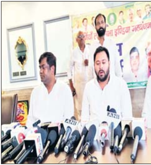
बिहार का लोकतंत्र सीमांचल का ही विकास नहीं हुआ है। उन्होंने कहा...