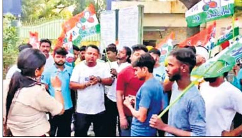
एक समूह ने पार्टी की मांग को लेकर फैक्ट्री के गेट पर तृणमूल का झंडा लगाकर विरोध प्रदर्शन किया। आरोप है कि नेताओं-मंत्रियों ने हर संभव कोशिश की, लेकिन उन्हें काम नहीं मिला जबकि बांकुड़ा, वीरभूम, पुठलिया जगहों से बाहरी लोग आकर नौकरी पा रहे हैं, फिर भी तृणमूल बनाम तृणमूल को लड़ना संभव नहीं दिखता है। घटना दुर्गापुर के कोक ओशन थाना अंतर्गत सागरभागा इलाके में एक निजी फैक्ट्री में हुई। इस बार स्थानीय तृणमूल कार्यकर्ताओं का

आरोप है कि नेताओं-मंत्रियों ने हर संभव कोशिश की, लेकिन उन्हें काम नहीं मिला जबकि बांकुड़ा, वीरभूम पुठलिया जगहों से बाहरी लोग आकर नौकरी पा रहे हैं