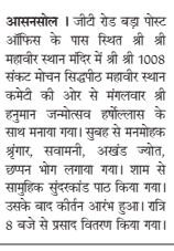
दर रात तक भजनों की अमृत वार्स एएस अहलूवालिया भी पूजा करने पहुंचे। इस मौके पर भाजपा प्रत्याशी

आसनसोल। जीटी रोड बड़ा पोस्ट ऑफिस के पास स्थित श्री श्री महावीर स्वामि मंदिर में श्री श्री 1008 संकट मोचन सिद्धपीठ महावीर स्वामि कमेटी की ओर से मंगलवार श्री हनुमान जन्मोत्सव हार्दिकता के साथ मनाया गया। सुबह से मनोहरक श्रुता, सामना, अर्घ्य ज्योत, छपन भोग लगाया गया। शाम से सामूहिक सुंदरकण्ड पाठ किया गया। उसके बाद कीर्तन अरंभ हुआ। रात्रि 8 बजे से प्रसाद वितरण किया गया हुआ। इस मौके पर भाजपा प्रत्याशी