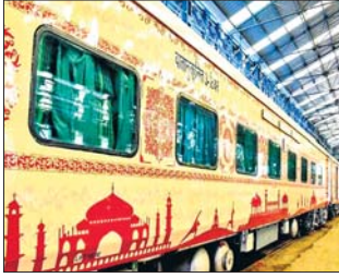
कोयंबटूर-बरौनी जं. साप्ताहिक समर स्पेशल 23.04.2024 और 25.06.2024 के बीच प्रत्येक

बरौनी जं. तांबरम साप्ताहिक समर स्पेशल प्रत्येक शनिवार को बरौनी जं. तांबरम से रवाना होगी और आसनसोल मंडल के बराचूर, पितरतंन, मधुपुर और जसीडीह स्टेशनों पर रुकेगी। आसनसोल। गर्मी के मौसम में गाड़ियों की आरिक्वियत भीड़ से निपटने के लिए रेलवे ने कोयंबटूर और बरौनी तथा तांबरम एवं बरौनी के बीच दो साप्ताहिक ग्रीष्मकालीन स्पेशल ट्रेन चलाने का निर्णय लिया है। 06:059