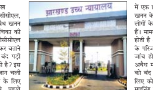
दि. वर्ष 2022 में बीसीसीएल पनचवाद के क्षेत्र

आवाज प्रतिनिधि। 24 अप्रैल रांची। झारखंड हाई कोर्ट ने बीसीसीएल, धनबाद में बंद पड़ी खदानों से अवैध खनन रोकने को लेकर दायर जनहित याचिका की सुनवाई बुधवार को की। कोर्ट ने बीसीसीएल के चेयरमैन को साथ पत्र दायित्व कर बताने को कहा है कि धनबाद क्षेत्र में बंद पड़ी खदानों से अवैध माइनिंग क्यों हो रही है? इस अवैध माइनिंग में कई लोगों की जान चली जाती है। ऐसी घटनाओं को रोकने के लिए क्या कार्रवाई की गई। इससे पहले याचिकाकर्ता की ओर से कोर्ट को बताया गया