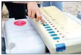
जेडीयू से हैं जबकि काँग्रेस से तीन और आरजेडी से दो प्रत्याशी हैं। 50 प्रत्याशी मैदान में हैं...