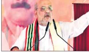
राजनाथ सिंह ने खुटी लोकसभा सीट से नामांकन पत्र दायित्व किया। इस मौके पर अरविंजत जसपना में केंद्रीय रक्षा मंत्री राजनाथ सिंह ने खुटी लोकसभा सीट से भाजपा प्रत्याशी अर्जुन मुंडा के लिए लोगों से जनसम्मेलन में भाग लेने का आग्रह किया।

कोलकाता। केंद्रीय गुहमंत्रि अमित शाह ने मंगलवार को शांति बंगाल की मुख्यमंत्री ममता बनर्जी पर तीखा हमला बोला है। उन्होंने कहा है कि ममता बनर्जी एक तरफ चुसपीछियों को बचाव देती हैं तो दूसरी तरफ नामरिक्ता संघोषना आधिपत्य (सीएनए) का विरोध कर शरणार्थियों को नामरिक्ता रोक रही हैं। शाह पंडित बंगाल के मालदा जिला में रोड शो किया। यहां शाह ने ममता सरकार पर जमकर निशाना साधा। उन्होंने कहा कि लोकसभा चुनाव में भाजपा राज्य की 30-35 लोकसभा सीटें जीतगी। अमित शाह ने कहा, तृणमूल जैसे प्रश्नार्थियों को बंगाल