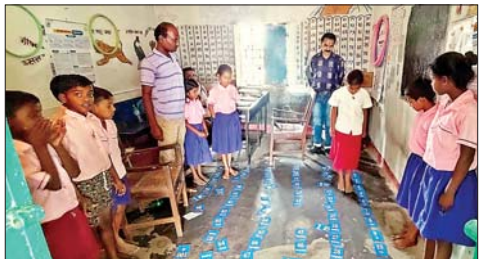
खेल के माध्यम से बच्चों को शिक्षा देते अग्यपाक।

जिसके परिणाम स्वरूप प्राथमिक विद्यालय के बच्चों की अंतिमी स्कूल के बच्चों के तरह हिंदी से लेकर इंग्लिश की शिक्षा कम ही दिनों में मनोरंजन के माध्यम से प्राप्त कर प्रारंभिक स्कूलों के बच्चों से जानकारी में टक्कर दे रहे हैं। जिसका नमूना आज सारठ प्रखंड अंतर्गत बड़वाड़ पंचायत के प्राथमिक विद्यालय शाबावाद व पालोजोरी प्रखंड के जमुआ प्राथमिक विद्यालय में देखने को मिला। जिसमें अंतिमी अक्षर ए से लेकर जैड तक के 26 अक्षर, हिंदी ककारा एवं 1 से लेकर 100 तक की गिनती के लिए शिक्षिका द्वारा साजा गए कार्ड के माध्यम से बच्चों फुटक फुटक कर मनोरंजन शुरू करते हैं। जिसके लिए प्रत्येक शिक्षक द्वारा प्रारंभिक विद्यालय के शिक्षिकाओं द्वारा बच्चों को खेल-खेल में पठन-पाठन कला के माध्यम से शिक्षा प्रदान करने में बच्चों की उपस्थिति में बढ़ोतरी के साथ-साथ शिक्षा के प्रति सजग करते हुए लुभावने शिक्षा से आकर्षित