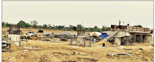
पुल निर्माण कार्य होते हुए।

था। जिसका पालन करते हुए सारठ के जल्द से जल्द इस महत्वपूर्ण पुल को गुणवत्तापूर्ण निर्माण कर दर्जनों से भी अधिक ग्रामीण रहसियों को सुविधा प्रदान करने का निदेश मान लिया गया।