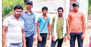
जलमीनार खराब होने से पेयजल की भारी किल्लत आवाज प्रतिनिधि। 23 अप्रैल दुमका : सरत प्रखंड दुमका के पारसिमला गांव में स्थित एकमात्र जलमीनार खराब होने से ग्रामीणों को पेयजल की किल्लत का सामना करना पड़ रहा है। ग्रामीणों ने बताया कि इस तारी धूप व जनलेवा गमी में वहां गांव का एक

मात्र जलमीनार दो महीने से खराब पड़ा है। ग्रामीणों ने पेयजल एवं स्वच्छता विभाग दुमका के कार्यपालक अभियंता, सहायक अभियंता एवं जल अभियंता से यहां बने सौर ऊर्जा संचालित जलमीनार को मरम्मत करवाकर चालू कराने की गुहार लगायी है, लेकिन बार बार आग्रह करने के बावजूद विभागीय अधिकारियों को सतना करके इस तारी धूप व जनलेवा गमी में वहां गांव का एक