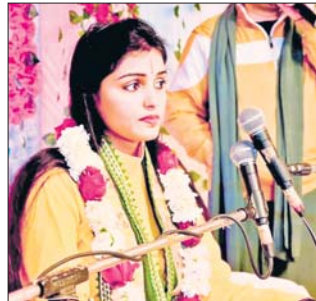
महारास में भगवान श्रीकृष्ण ने वसुंधरी वजाकर गोपीयो का आह्वान किया और महारास लीला द्वारा ही