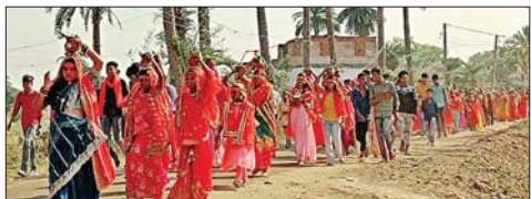
कलश लेकर जाती महिला श्रद्धालु।