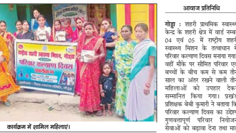
कार्यक्रम में शामिल महिलाएं।