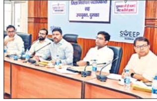
सुनिश्चित करें जिला निर्वाचन पदाधिकारी ने कहा कि सभी मतदान केंद्रों तक जाने के लिए रूट चार्ट बनाए गए हैं निर्धारित

रहने पर अपने एड्रेसरों को अवगत कराए (इन्होंने कहा कि प्रशिक्षण में जो भी जानकारियां दी गयी हैं। मतदान दिवस के दिन उक्त जानकारियों के मदद से आप सभी अपने कार्यों का निर्वहन विना किसी गलती के कर सकेंगे इन्होंने एड्रेसरों को टीम वर्किंग हेतु रूट चार्ट बनाने का निदेश दिया उन्होंने कहा कि मतदान संपन्न होने के बाद सभी ईवीएम सूचना बल को देवघर रेलवे में मतदान केंद्र से कलेक्शन सेंटर तक पहुंचाया जाएगा बैठक में विभिन्न कोषांग के वरिष्ठ पदाधिकारी उपस्थित थे।