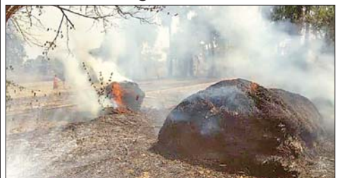
बोझ में लगी आग।