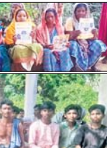
शिकारीपाड़ा : लोकसभा निर्वाचन 2024 में हर एक योग्य मतदाता अपने मतदाधिकार का प्रयोग करे इसे ध्यान में रखते हुए स्वीप और प्रवाह शाखा, शिकारीपाड़ा के संयुक्त तत्वाधान में नरे युवा और महिला मतदाताओं को जागरूक किया गया। शिकारीपाड़ा प्रखंड के अमरागोड़ा और सुंदामलन गांव में मतदाता जागरूकता कार्यक्रम के अंतर्गत मतदान का महत्व, लोकतंत्र में जनता की भागीदारी, जनता दारा चुने गए प्रतिनिधि कैसे सक्षमता का गठन करते हैं और उचित तथा कदाचारमुक्त चुनाव के बारे में सभी जागरूक किया गया।