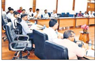
सेक्टर पदाधिकारी अपने सभी मतदान केंद्रों का प्रभण कर मतदान केंद्रों पर उपलब्ध न्यूनतम मूलभूत सुविधाओं का अवलोकन कर

सरेयाहाट, जरमुंडी तथा गोपीकांदर प्रखंड के सेक्टर पदाधिकारियों के साथ बैठक की एवं उनके कार्यों से अवगत कराया जिला निर्वाचन पदाधिकारी ने निदेश दिया कि सभी