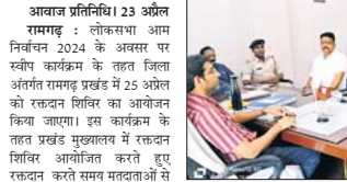
आवाज प्रतिनिधि। 23 अप्रैल रामगढ़ : लोकसभा आम निर्वाचन 2024 के अवसर पर स्वीप कार्यक्रम के तहत जिला अंतर्गत रामगढ़ प्रखंड में 25 अप्रैल को रक्तदान शिविर का आयोजन किया जाएगा। इस कार्यक्रम के तहत प्रखंड मुख्यालय में रक्तदान शिविर आयोजित करते हुए रक्तदान करते समय मतदाताओं से मतदान (1 जुन) के दिन अपने चिकित्सा पदाधिकारी एवं स्वास्थ्य कर्मियों को प्रति निरूपण करने हेतु सूचित किया गया है। बैठक शिविर में अतिरिक्त शिल्प चित्रकार सह मुख् चिकित्सा पदाधिकारी दुमका के तापक 12/5/20.04.2024 के द्वारा

होमोप्याथिन, मलेरीया, एचआईवी, एचसीवी, वीडोआरएल आदि जांचें हो जाती हैं। प्रखंड विकास पदाधिकारी ने भीड़वत के द्वारा आम जन से आह्वान की है कि रक्तदान के माध्यम को लोगों तक पहुंचाएं तथा उन्हें रक्तदान हेतु प्रेरित करें। हालांकि जेटी न्यूज ऐसे नके कार्यों के लिए संचयन तैयार रहती है। जेटी न्यूज रामगढ़ के पाठकों से अपील करती है कि रक्तदान में बंद-चढ़कर हिस्सा ले और रक्तदान को अपना वीर्यवर्तिता का खतरा भी कम हो जाता है। रक्तदान से सबसे बड़ा फायदा यह होता है कि हमारे शरीर का बजन, ब्लड प्रेशर, कोलेस्ट्रॉल