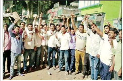
सुशी जाहीर करते कार्यकर्ता।