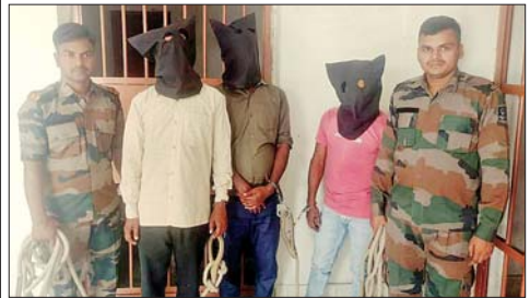
गिरफ्तार आरोपी और पुलिस।