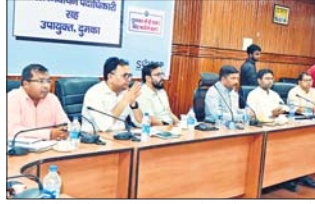
कि अपने सेक्टर से मतदान केंद्रों की दूरी को भी मॉक पोल कर लें ताकि मतदान दिवस के दिन किसी प्रकार के संशय की स्थिति को उत्पन्न