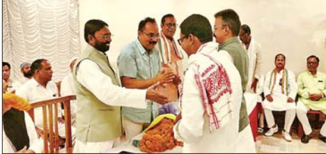
कांग्रेस के गोड्डा लोकसभा प्रत्याशी से बैठ कर मुक्तिदा।