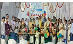
सांस्कृतिक कार्यों से वञ्चत हुए हैं। हमारा संकल्प, न. प्रमाण मिशन महिलाओं के कोशल का निर्माण करने उन्हे रोजगार योग्य बनाना है, जिससे वे अपनी कमाई के माध्यम से अपने परिवार को आर्थिक रूप से समर्थन देने में सक्षम हो सकें। इस उद्देश्य से, हमने एचएचए सशक्तिकरण मिशन की शुरुआत की, जिसमें शुरुआत में मुन्न सिलहंड कक्षाएं प्रदान की गईं। जल्द ही, हम कुबिस

रानीगंज | हमारा संकल्प, एक अग्रणी गैर सरकारी संगठन है जो बंगला सिमा में अपने प्रयासों के लिए जाना जाता है, ने पंधम बंगला, बिहार और उधर प्रदेश में 4000 से अधिक छात्रों के साथ महत्वपूर्ण प्रयास डाला है। संसदन में अब महिलाओं और विकलांग व्यक्तियों के लिए सशक्तिकरण गतिविधियों को शामिल करने के लिए अपने मिशन का विस्तार करने का निर्णय लिया है। भारत की आवादी में महिलाओं का आधा हिस्सा होने के बावजूद, आर्थिक विकास में उनका योगदान जैविक है वैज्ञानिक कार्यों के बजाय सामाजिक, धार्मिक और