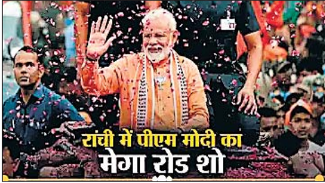
रांची में पीएम मोदी का मेगा रोड शो

एजेन्सी 13 मई चाईबासा : प्रधानमंत्री नरेन्द्र मोदी शुक्रवार को दो दिवसीय दौरे पर चाईबासा पहुंचे। उन्होंने चाईबासा के टाटा कलेज मैदान में चुनावी जनसभा को संबोधित करते हुए कांग्रेस पर जनकद निशाना साधा। मोदी ने कहा कि कांग्रेस संविधान में बदलाव कर ओबीसी, अद्वितीय और पिछड़े का हक खीन लेगी और मुसलमानों को दे डे। कर्नाटक में रातों-रात एक फतवा निकाला गया, जिसमें वे कहा गया कि कर्नाटक में हिन्दू भी मुसलमान हैं वह सच ओबीसी हैं। इसमें बाद उन्हें ओबीसी आरक्षण दे दिया गया और पूरा देश दहला रहा गया। उन्होंने कहा कि वे मेरे गांधी हैं कि उनके रहते कोई भी संविधान को साथ भी नहीं ला सकता। मोदी ने कहा कि झारखंड में