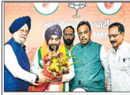
लवली के जाने पर वही लोग कांग्रेस अरविंद सिंह लवली को अलग आदमी पार्टी के कार्यकर्ताओं का भी पूरा समर्थन नहीं मिल पा रहा है।

एजेंसी। 4 मई नई दिल्ली। दिल्ली में लोकसभा की चुनावी विचारधारा लिफ्टरस हो गई है। प्रदेश कांग्रेस के अध्यक्ष अरविंद सिंह लवली ने बीजेपी में शामिल हो गए हैं। लवली बीजेपी के दिग्गज नेताओं में बंगालती तैवर अखिलेश्वर कर रहे हैं। इसकी बगल में शनिवार देवरा के को भी मिली। पूर्व प्रदेश कांग्रेस अध्यक्ष अरविंद सिंह लवली के साथ चार दिग्गज नेताओं में भाजपा का यमन थाम लिया। प्रदेश कांग्रेस नेता अरविंद नेतुल से जो नाराज हैं। उन्होंने बिना तबज्जी दिए आम आदमी पार्टी के साथ गठबंधन और उम्मीदवार को उतारना रस नहीं आया। कन्हैया कुमार के रूप में बाहरी नेता को और डॉ. उदित राज को आश्रित सीट से चुनाव में उतारना दिल्ली के पुराने