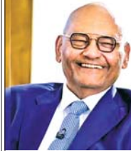
वेदांता ग्रुप के चेयरमैन अनिल अग्रवाल

एप्सेंसी 4 मई नई दिल्ली। अनिल अग्रवाल के नेतृत्व वाले वेदांता ग्रुप ने भारत को लेकर अपना रोडमैप तैयार कर लिया है।