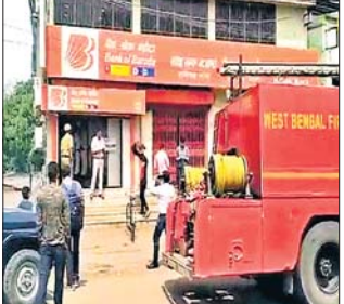
जल्द आग पर काबू पा लिया, उन्होंने कहा कि ऐसा घटना के साथ यहाँ पर पहुंच गए और बहुत