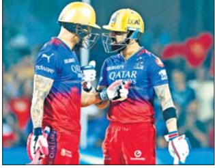
आईपीएल 2024 में पावरप्ले में सबसे कम स्कोर

एजेन्सी। 4 मई बेंगलुरु। आज रविवार को खेले गए आईपीएल 2024 का 53वां मुकामबला खेला गया। बेंगलुरु ने टॉस जीतकर पहले गेंदबाजी का फैसला किया है। गुजरात टाइटन्स को टीम 19.3 ओवर में 147 रन बनाकर ऑलआउट हो गईं। जबकि बेंगलुरु ने 13.4 ओवर में छह विकेट गंवाकर 152 रन बनाए और मुकामबला चार विकेट से अपने नाम कर लिया। आईपीएल 2024 के 52वें मैच में रविवार को खेले गए मुकामबला में गुजरात टाइटन्स को टीम 19.3 ओवर में 147 रन बनाकर ऑलआउट हो गईं। जबकि बेंगलुरु ने 13.4 ओवर में छह विकेट गंवाकर 152 रन बनाए और मुकामबला अपने नाम कर लिया। 148 रनों के लक्ष्य का पीछा करने