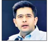
रोशनी हमेशा के लिए जा सकती

एजेंसी। 2 अप्रैल नई दिल्ली। आप नेता राघव चट्टा को लेकर एक बड़ी हेल्थ अपडेट चर्चा में है। टीओआई की रिपोर्ट के अनुसार, उनकी पार्टी के नेता सौरभ भाद्राज ने बताया कि राघव चट्टा लंदन में आई सर्जरी के लिए गए हैं। उन्हें आंखों की गंभीर समस्या थी, जिसकी वजह से उनकी आंखों की