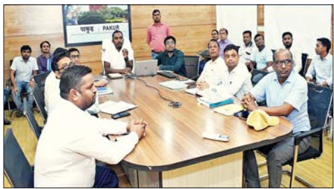
उपनिवेश डीसी व अन्य।