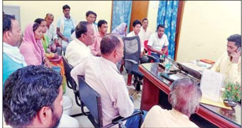
ग्राम प्रधानों के साथ बैठक करते अंचलाधिकारीको।