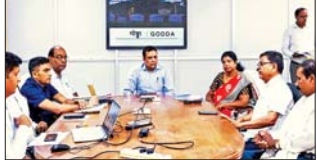
ईसी ज़िशन कम्प व अन्य।