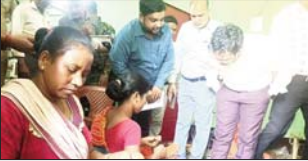
आदिवासी महिलाओं से उनकी समस्या को सुने डीसी समेत अन्य

खुदाना गांव पहुंचे। सबसे पहले आदिवासी महिलाओं द्वारा उपयुक्त के अंगे संभाली रिरी रिवाज से स्वागत किया। उसके उपरांत उपयुक्त ने आदिवासी जागरूक रोजगार के सभी महिलाओं से मिलकर उनके बारे में जाना। उपयुक्त ने जाना कि इस कायालय से जुड़ी महिलाएं पहले क्या करती थीं अब सभी महिलाएं किया कर रही हैं। महिलाओं को