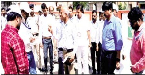
स्टेशन परिसर का निरीक्षण करते एडीआरएम