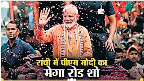
रांची में पीएम मोदी का मेगा रोड शो

एजेसी 13 मई चाईबासा : प्रधानमंत्री नरेन्द्र मोदी शुक्रवार को दो दिवसीय दौरे पर चाईबासा पहुंचे। उन्होंने चाईबासा के टाटा कॉलेज मैदान में चुनावी जनसभा को संबोधित करते हुए कांग्रेस पर जमकर निशाना साधा। मोदी ने कहा कि कांग्रेस संविधान में बदलाव कर ओबीसी, आदिवासी और पिछड़े का हक छीन लेगी और मुसलमानों को दे देगी। कर्नाटक में रातों-रात एक फतवा निकाला गया, जिसमें वे कहा गया कि कर्नाटक में हिन्दू भी मुसलमान हैं वह सच ओबीसी हैं। इसमें बाद उन्हें ओबीसी आरक्षण दे दिया गया और पूरा देश दहलात रह गया। उन्होंने कहा कि वे मेरे जाते हैं कि उनको रहने कोई भी संविधान को साथ भी नहीं ला सकता। मोदी ने कहा कि झारखंड में