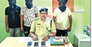
गिरफ्तार साइबर अपराधी के साथ थाना प्रभारी