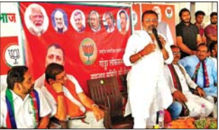
कार्यक्रम को संबोधित करते भाजपा प्रत्याशी निशिकांत दुबे