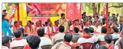
भाजपा कार्यकर्ताओं को संबोधित करते हुए दुमका लोकसभा प्रत्यासी

को लड़ाई के नाम पर रात के अंधेरे में सोइ कर जनता को धोखा देने वाले संगठन के मुखिया को जेल जाने के बाद आप सभी के समझ