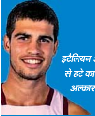
इटैलियन ओपन से हटे कार्लॉस अल्काराज

औद्योगिक क्षेत्र का प्रमुख दैनिक (स्थापित : 15 अगस्त, 1947)