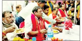
मुट्ठी घूघनी खाते निशिकांत दुबे।

गोड्डा। लोकसभा चुनाव का रण सज चुका है। प्रत्याशी मैदान में चिलचिलाती धूप में पसीना बहा रहे हैं। लोगों के बीच जाकर संपर्क कर रहे हैं। अपने-अपने अंदाज में पार्टी प्रत्याशी लोगों को रिश्ताने में जुटे हैं। इसी कड़ई में गोड्डा सांसद निशिकांत दुबे का भी अलग अंदाज दिखा। पहले बोले हुए बातों पर भाजपा प्रत्याशी ने मुरार लगाया। आखिरकार उन्होंने कार्यकर्ताओं के साथ मुट्ठी घूघनी खा ही लिया। इसके अलावा कार्यकर्ताओं के घर पर नींबू पानी भी पिया।