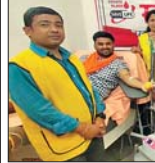
रक्तदान करते रक्तदात्री।