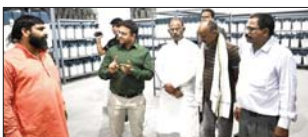
राजनीतिक दलों के प्रतिनिधियों की उपस्थिति में खोला गया वेयरहाउस