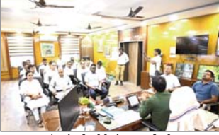
बैठक में शामिल डीसी समेत अन्य पदाधिकारी

साहेबगंज। जिला निर्वाचन पदाधिकारी सह-उपायुक्त हेमंत सती ने कार्यालय प्रकाश में पदाधिकारियों के साथ बैठक कर मतदाता जागरूकता को लेकर आवश्यक दिशा निर्देश दिए। जिसमें मतदाता जागरूकता कार्यक्रम को बढ़ावा देने एवं अलग-अलग थीम पर मतदान के प्रति मतदाता जागरूक कराया जाए। लोकसभा चुनाव -2024 को लोकतंत्र के महावर्ध के रूप में मना रहे हैं। इसे लेकर विभिन्न स्तर पर जागरूकता अभियान भी चल रहा है। निर्वाचन को अधिक करिको को ब्यवहार में अंतर कर रहे हैं, हम सभी को इसमें अपना योगदान देने के साथ अपने आस-पास इसके प्रति लोगों को प्रेरित भी करना है। लोकसभा