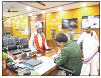
समस्या को सुने डीसी