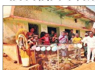
गांव गांव भ्रमणकर साफ सफाई का निरीक्षण करते मुखिया

बोतल फेंका हुआ ना हो या अगर है तो कोई बोरा में एक जगह भर दें तथा सभी घरों को यह सूचित कर दें की अब कोई भी व्यक्ति प्लास्टिक बाहर गंदगी या प्लास्टिक ना फेंके कर अपने घरों में बोरा में भर कर रखें। क्योंकि अब कचुआसोली के सभी गांवों में प्लास्टिक बैक की शुरूआत किया जाना तय है। जिसको शुरूआत कचुआसोली गांव से की जा रही है जिसमें जमा की गई प्लास्टिक को उचित ढांगों में खरीदा जायगा और उसे रीसाइकलिंग कर पुनः नया वस्तु बनाने की प्रक्रिया प्रारंभ की जायगी। जिससे प्लास्टिक अपशिष्ट का बेधर प्रबंधन हो पायगा। आगे के गांवों में जो भी प्लास्टिक जमा हैं उसे उचित