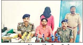
जब्त शराब, पीछे छुड़ा आरेखी व पुलिस पदाधिकारी।

गोड्डा। बीती रात्रि करीब 10.30 बजे एनएसटी टीम को गुप्त सूचना प्राप्त हुई कि एक व्यक्ति मोटर साइकिल पर दो शोला में अवैध रूप से विदेशी शराब तस्करों के लिए बलबुद्ध से छापछात को ओर जा रहा है। उक्त सूचना के आधार पर बलबुद्ध से छापछात जाने के क्रम में थिरो सलेन्डर ड्राइव मोटर साइकिल के पिछे में दो शोला बांधे हुए है। मोटर साइकिल सवार को एनएसटी टीम के द्वारा रोका गया, तो वह