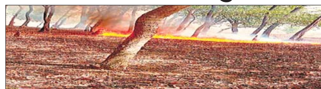
जमुआ जंगल में लगी

आवाज प्रतिनिधि पालोजोरी। अस्माजिक तत्वों द्वारा पतझड़ के मौसम आने के पश्चात की महुआ चुनई के समय आते ही जंगलों में आग लगाकर अपने पैड़ के निचले स्थान को सफाई करने के