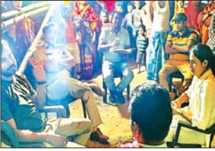
ग्रामीणों को समझाते संस्था के सदस्य व पुलिस