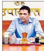
ईसी ज़िशन कम्प।

सुनिश्चित करने को लेकर सभी अधिकारियों एवं कर्मियों को पोस्टल बैलेट पर के माध्यम से बौद्धिक करने से संबंधित निर्देश दिए। बैलेट में उपयुक्त ने पोस्टल