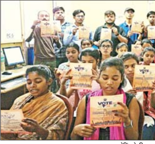
यौटिंग के लिए जागरूक करते छात्र।