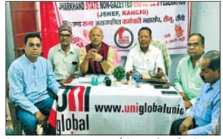
दिनांक 8 घंटा काम, 8 घंटा आराम व 8 घंटा मनोरंजन को संवैधानिक रूप से स्वीकृति दी गई है लेकिन आज भी मजदूरों व कर्मचारियों को इसका लाभ नहीं मिल पा रहा है। जो चिंतनजनक है। उन्होंने कहा कि भारत सरकार को 1 मई को अवकाश को स्वीकृति दी गई है किंतु इस अवकाश को एनआई एक्ट 1981 में शामिल नहीं करने के कारण सरकार द्वारा नजरअंदाज किया जा रहा है। महासंघ की मांग