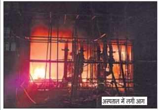
अस्पताल में लगी आग