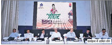
शिखर सम्मेलन में प्रमुख हिताधारकों और बिडर्स के शिखर सम्मेलन का आयोजन...