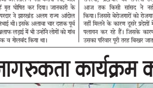
कार्यक्रम में शामिल रोटरी क्लब के सदस्य