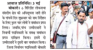
नामांकन का दाखल मस्कीटोने प्रत्याशी

आवाज प्रतिनिधि। 3 मई बोकारो। 6 निर्दिष्ट लोकसभा संसदीय क्षेत्र की अधिसूचना जारी होने के पांचवें दिन कुल चार ने नामांकन प्रपत्र दिए।