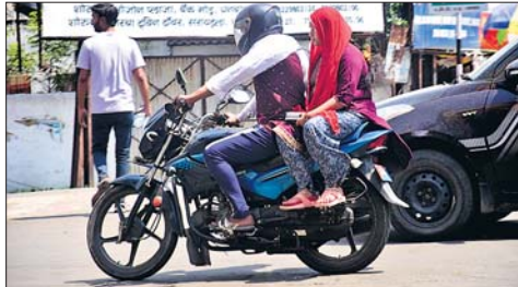
मौसम का मिजाज बदलेगा जिससे भीषण गर्मी और लू के खतरों से राहत मिलेगी।

आवाज प्रतिनिधि। 3 मई धनबाद। मौसम विभाग के अनुसार 4 मई शनिवार को मौसम सामान्य रहेगा। वहीं 5 मई को धनबाद समेत कुछ क्षेत्रों में हीट वेव की स्थिति देखी जा सकती है। हालांकि विभाग ने मौसम में बदलाव के भी संकेत दिये हैं। 6 मई को हल्की वर्षा का अनुमान है। उसके बाद 7 और 8 मई को भी मौसम मेहरबान रहेगा। 7 को हल्के से मध्यम दर्जे की वर्षा होने की संभावना है। 8 को गर्जन के साथ धनबाद समेत राज्य के ज्यादातर भागों में बारिश हो सकती है। रांची केन्द्र के मौसम वैज्ञानिक अभिषेक अनंद के अनुसार एक दिन बाद