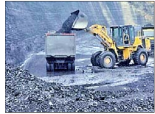
काली राई में शुरू होती है जो दर रात खतती है। सुप्रीं के अनुसार प्रति दिन तीनों हिलकार तस्करोँ 200 टन अवैध कोयले की तस्करी कर अपने और मोहिंदपुर के कुछ हार्डकोक प्लांट में खरा देते हैं। बताया जाता है कि ये लोग कुछ गाड़ियों का एक संवर का भी कोयला संग्रहित हैं। जिला प्रशासन की आंखों में भूल डौंका जा सके।