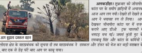
आग बुझाने दमकल बहन

अलकडीहा। शुक्रवार को जीनागोरा कांटा घर के सामने झाड़ियों में अचानक आग आग लग गयी। देखते ही देखते ही आग ने भयावह रूप ले लिया। आग देखकर जीनागोरा कांटा घर में वजन कराने आए डीओ टुक चालकों में भगदड़ मच गई। जमर्स कुंजी नूट के राखबल सिंह और कांटा के कर्मियों ने लौटान क्षेत्र के महाप्रबंधक को सूचना दी तब महाप्रबंधक ने दमकल और डंपर को भेज कर बड़ी मशरकत बाध एक से डेढ़ घंटे बाद आग पर काबू पाया।