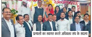
प्रत्याशी का स्वागत करते अधिवक्ता संघ के सदस्य