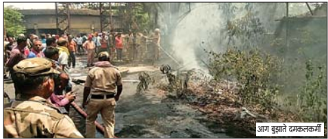
आग बुझाने दमकलकर्मी