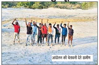
आंदोलन की वेतवनी देते ग्रामीण