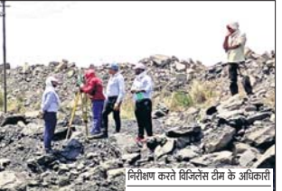
निरीक्षण करते विजिलेंस टीम के अधिकारी

आवाज प्रतिनिधि। 3 मई अलकट्टी। विजिलेंस टीम शुक्रवार को लोदना क्षेत्र पहुंची और सबसे पहले साइडिंग और लोडिंग प्वाइंट पर निरीक्षण के लिए गयी। इसके बाद 9 नंबर साइडिंग और जीनोरा कांटा पर गईं। साइडिंग एवं लोडिंग प्वाइंट पर कोयले के स्ट्याक जांच की। विजिलेंस टीम के आने से अधिकारियों और लोडिंग बाबू में खलबली मची हुई थी। हालांकि विजिलेंस टीम और