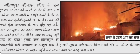
कचरे से उदती आग की लपटें