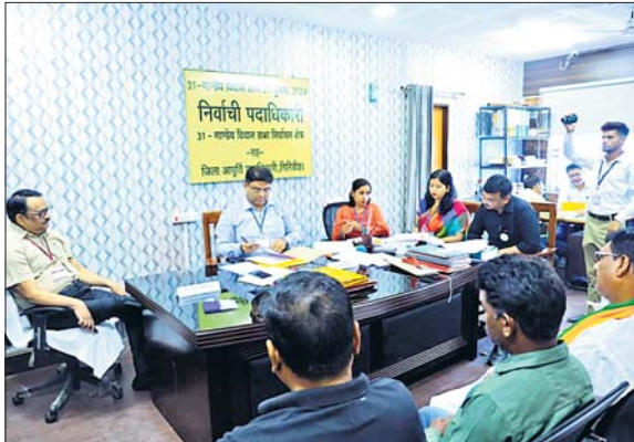
प्रत्याशी रह गए हैं। स्कूटनी में 1 प्रत्याशी का पर्चा रद्द कर दिया गया। और अब इस प्रकार कोडरमा के चुनावी रण में