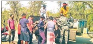
कोयला और बाइक जहां करती पुलिस

आक्रोशित ग्रामीणों ने पुलिस के रवैये पर उलटिया सदा दिन-रात वोकारो जिला में खपाया जा रहा अवैध कोयला